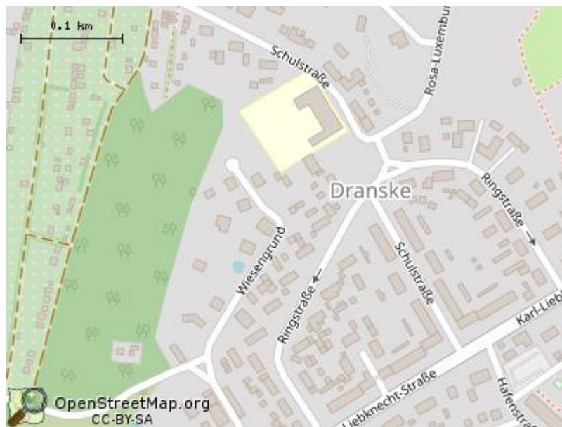
Nonnewitz 25 a-b, 18556 Dranske

Kaufpreis: 180.000,00 € Wohnfläche (ca.): 75,00 m 2 Zimmer: 3