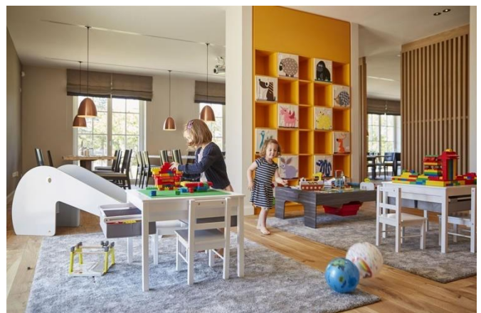
Kinderbereich im Restaurant